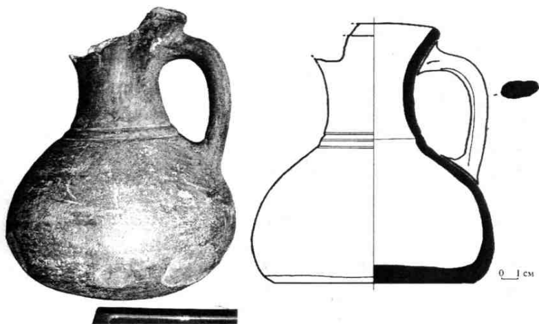
Рис. 3. Столовый кувшин с территории г. Чугуева.

признаков расположения археологического памятника не выявлено.