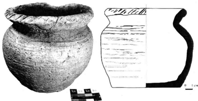
Рис. 1. Кухонный горшок из фондов Художественно-мемориального музея И.Е. Репина.

шок представляет собой лепной одутловатый толстостенный сосуд с отогнутым наружу уплощенным по верху венчиком, украшенном косыми насечками. Край венчика имеет небольшую утрату и трещину. По тулову горшка прослеживается плохо выраженный нарезной линейный орнамент. Сосуд имеет крутые плечики и широкое дно. В тесте наблюдается примесь керамического шамота. Внутренняя поверхность черепка носит следы радикального пальцевого заглаживания по сырому тесту. Также изнутри имеется нагар, что свидетельствует об использовании сосуда для приготовления пищи. На внешней поверхности прослеживаются многочисленные раковины, образованные выгоревшими органическими включениями. Толщина стенки сосуда достигает 9 мм. Днище имеет диаметр примерно 10 см, венчик примерно 12 см. Высота горшка достигает 11,5 см. Наибольшая ширина изделия – 13,5 см. Форма имеет выраженную асимметричность. По типологии салтово-маяцкой керамики Б.А. Шрамко рассматриваемый нами кухонный горшок имеет признаки первого и третьего типов, аналоги которым были находимы в катакомбном могильнике Верхнего Салтова [3, с. 245, 246, рис. II, 1, 2]. В.А. Сарапулкин от-