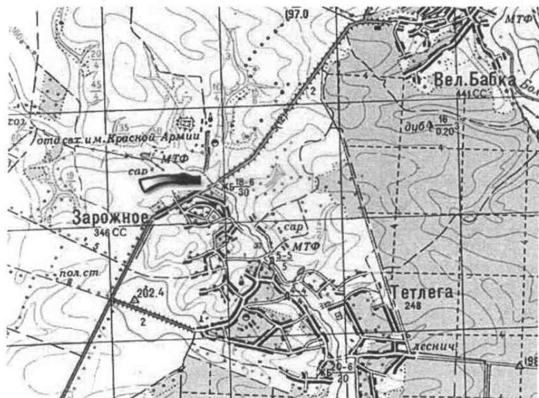
Рис. 1. Карта с указанием места нахождения хозяйственного топора.

По своим параметрам найденный топор относится, согласно В.К. Михееву, к первому типу хозяйственных топоров, применявшихся носителями салтово-маяцкой культуры – узколезвийных с прямоугольным или квадратным обухом, клиновидным со стороны торца [5, с. 68]. Длина деревянных прямых – преимущественно округлых или овальных в поперечном сечении – рукоятей таких топоров, рассчитанная по методике В.А. Желиговского [3], составляла 50-60 см. Такими топорами-колунами, скорее всего, пользовались лесорубы. Узколезвийные топоры появляются на территориях восточных римских провинций на рубеже эр. Во вт. пол. I тыс. н.э. они получили распространение у многих народов Восточной и Центральной Европы, в том числе и на Руси [4, с. 101-102; 5, с. 68-69]. В салтово-маяцкой среде, по мнению В.К. Михеева, рабочие топоры появляются под влиянием оседлого славянского и финно-угорского населения, у которого